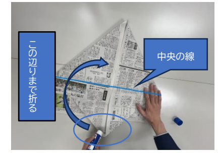
⑩ひし形の先にのりを付け(丸印部分)中央の線を超えるところまで折り、貼り合わせます。(反対側も同様に貼り合わせます。)