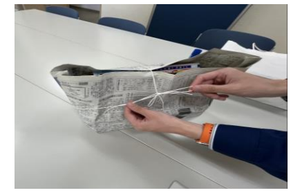
⑮ひもで十字に縛って、ごみステーションに出すことができます。