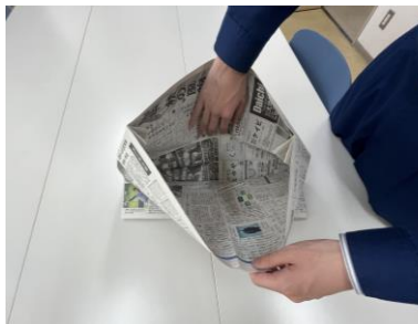
⑦立ち上げた部分を、真ん中で袋状に広げます。