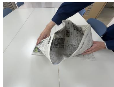
⑧広げた部分を内側に押しつぶしながらひし形を作ります。