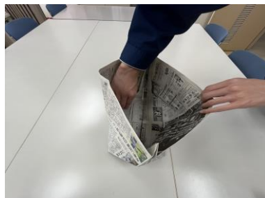
⑫袋を立てて、底が平になるように開き、四隅に角を付けます。