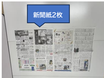
①新聞紙2枚とのりを用意します。