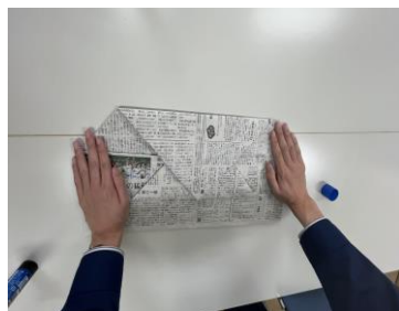
⑪袋の底が完成です。