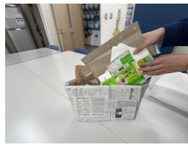
⑭雑がみを入れます。