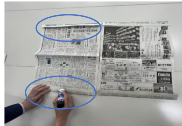
③左側の新聞紙の折ったところ(丸印部分)にのりを付けます。