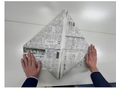
⑨ひし形の完成です。