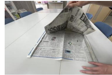
④③でのり付けした部分と、右側の折った部分を貼り合わせます。